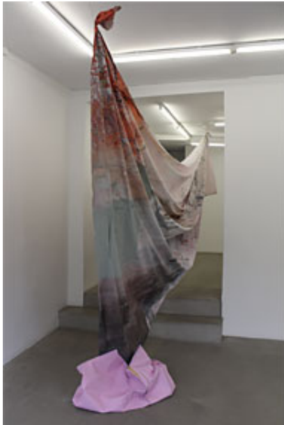
ta och dra (Klicka på bild för hög upplösning)