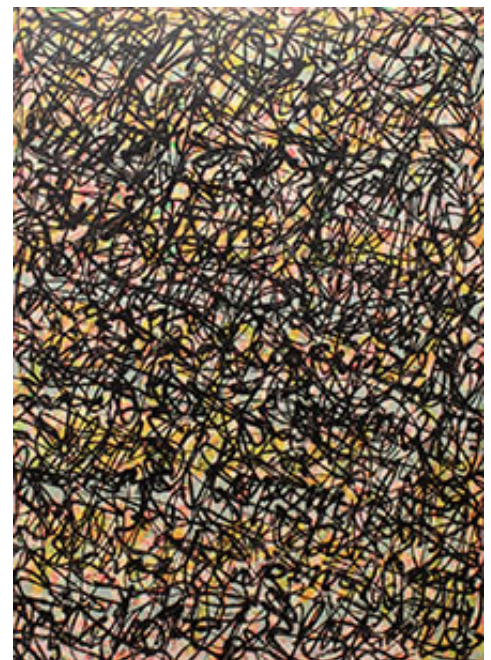
I write my name because it matters #3