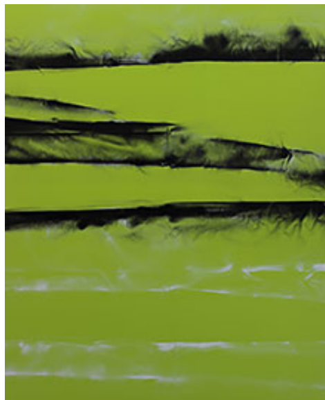
Go/No go © A. Erika Bergström

Galleri Box, Göteborg | Omkonsts startsida