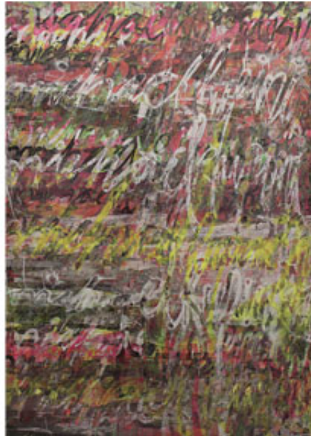
I write my name because it matters #5 (Klicka på bild för hög upplösning)