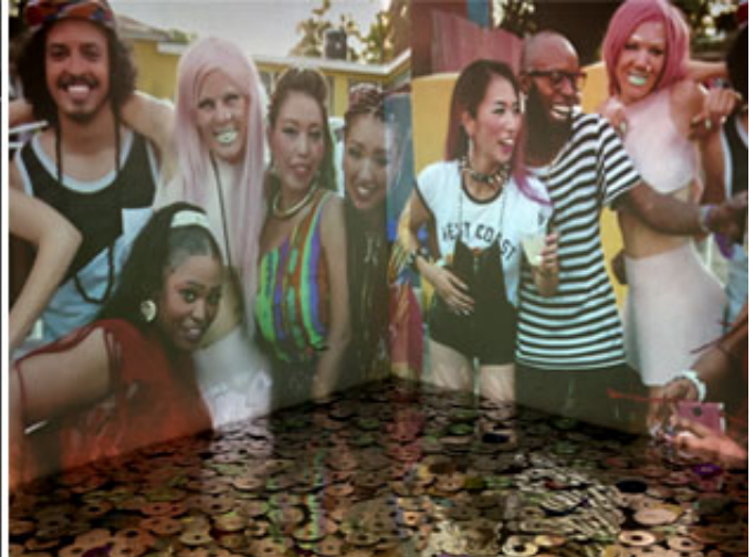
© Anna Rokka och Rut Karin Zettergren

Till höstens stora konsthändelse hör självfallet GIBCA, Göteborgs biennial för samtidskonst ( läs recension ). Vid sidan av centrum finns Göteborgs gallerier, om än verksamma i motvind inte minst medialt. Några av dem ingår med sina aktuella program i Gibca Extended som är tänkt att stötta det lokala konstlivet. Under senare år har galleriscenen krympt och samtidigt koncentrerat sig till ett par promenadvänliga stråk. I samband med öppningen var det "benet" mellan Galleri PS på Kaponjärgatan i Haga över galleristråket på Kastellgatan upp till Konstepidemin som innehöll intressanta inslag och nyöppnade utställningar.