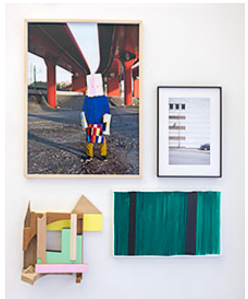
© Eric Magassa, Björn Körner, Merete Lassen, Ivar Lövheim

Galleri Aveny | Galleri 54 | Nevven Gallery | Galleri Box | Konstepidemin | Galleri PS | Konstnärscentrum Väst | Omkonsts startside